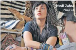
Hindi Zahra PAGE 18