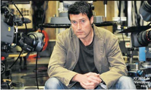
JO 2010 de Vancouver PAGE 4